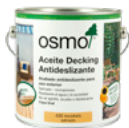
Aceite Decking Antideslizante