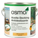
Aceite Decking Antideslizante