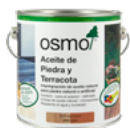
Aceite de Piedra y Terracota

Dado que la impregnación no tiene ingredientes biocidas activos, puede aplicarse en áreas cercanas a la comida, como en barbacoas de piedra o ladrillo.